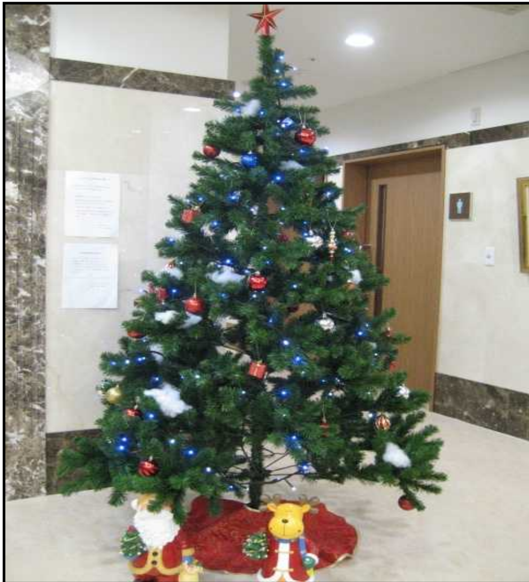
クリスマスツリー

クリスマスになれば、あちこちで見かけるクリスマスツリー。その由来は8世紀のドイツにさかのぼると言われています。当時のドイツのドルイド教団員(キリスト教に改宗する以前の古代ケルト族の僧・妖術師・詩人・裁判官など)と呼ばれる人たちが、オーク(木)を崇拝し、幼児犠牲を捧げていました。