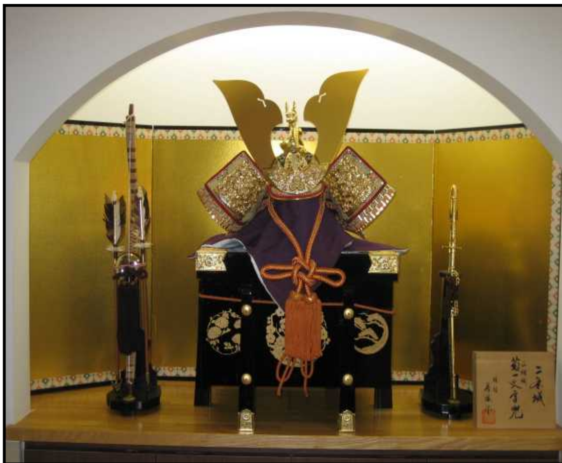
端午の節句・・・由来

日本の端午(たんご)の節句は、奈良時代から続く古い行事です。端午というのは、もとは月の端(はじめ)の午(うま)の日という意味で、5月に限ったものではありませんでした。しかし、午(ご)と五(ご)の音が同じなので、毎月5日を指すようになり、やがて5月5日のことになったとも伝えられます。当時の日本では季節の変わり目である端午の日に、病気や災厄をさけるための行事がおこなわれていました。この日に薬草摘みをしたり、蘭を入れた湯を浴びたり、菖蒲を浸した酒を飲んだりという風習がありました。厄よけの菖蒲をかざり、皇族や臣下の人たちには蓬(よもぎ)などの薬草を配り、また病気や災いをもたらすとされる悪鬼を退治する意味で、馬から弓を射る儀式もおこなわれたようです。