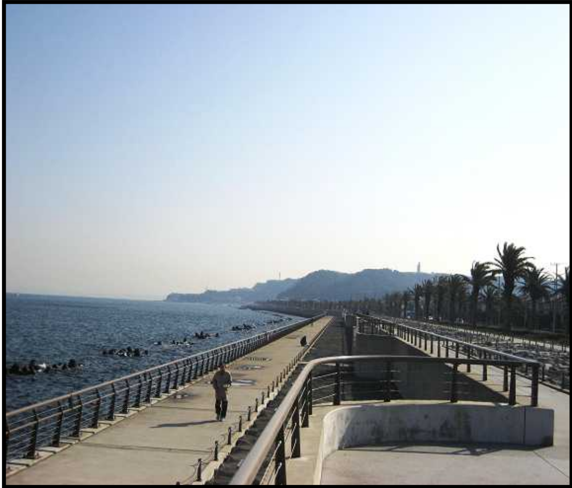
馬堀海岸プロムナード うみかぜの路

ナーシングホーム北久里浜から車で約10分の場所にあります、馬堀海岸は古くから台風による大規模な越波により、護岸背後の住宅地の冠水や、国道16号の通行止め等、多大な被害に悩まされてきました……平成18年塩害対策と地域活性化を目的として「プロムナードうみかぜの道」がつけられました。