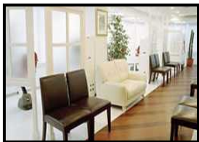
ヘアカットサロン[it's!] 自由が丘本店