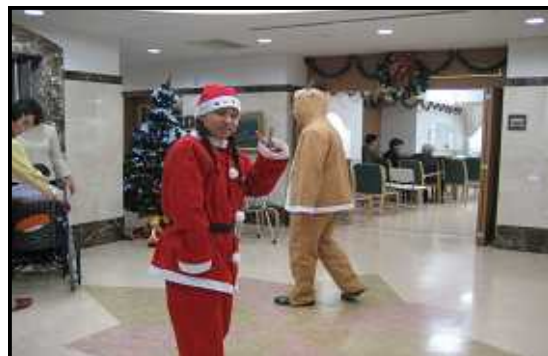
サンタクロースとトナカイ